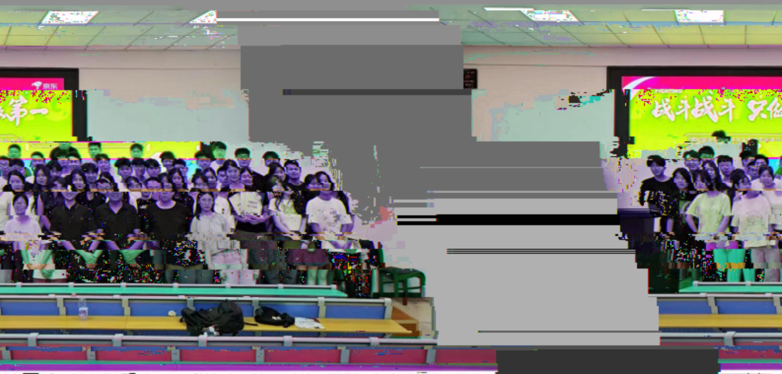
6月，漯河职业技术学院2022级跨境电子商务专业学生京东校园实训项目总结