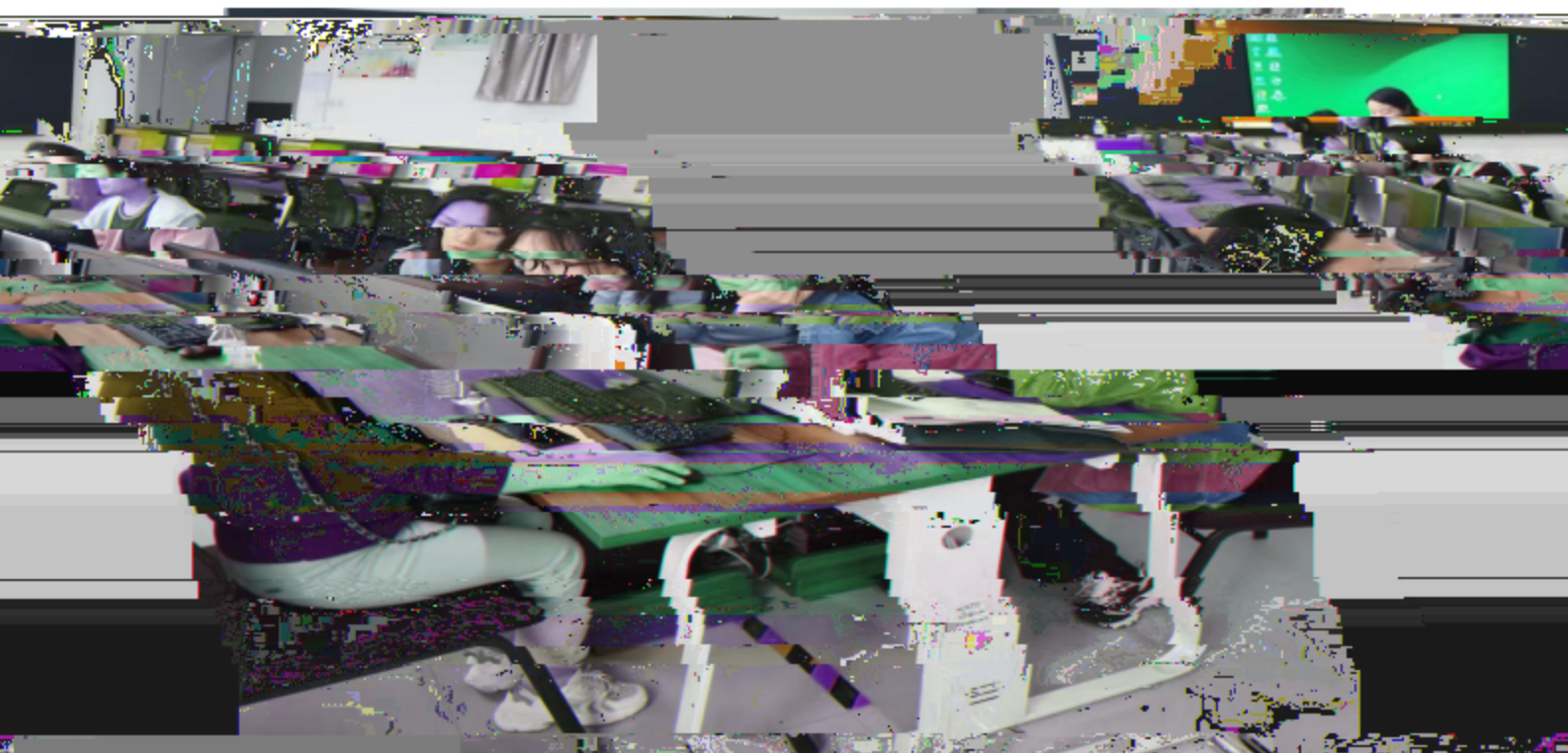
2024年4月，公司项目经理对漯河职业技术学院电商教研室教师进行岗位技能培训