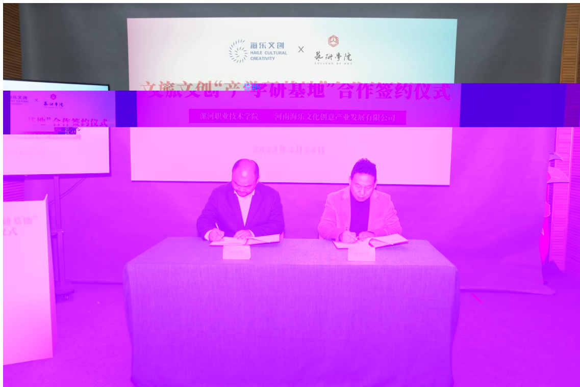
2023年3月，漯河职业技术学院与公司签订校企合作协议书

技 发 的 攻 关 ， 动 点 涵 发 。 过 创 践 ， 公 打 爱 的 创 产 ， 河 创 发 的 ， 高 动 。