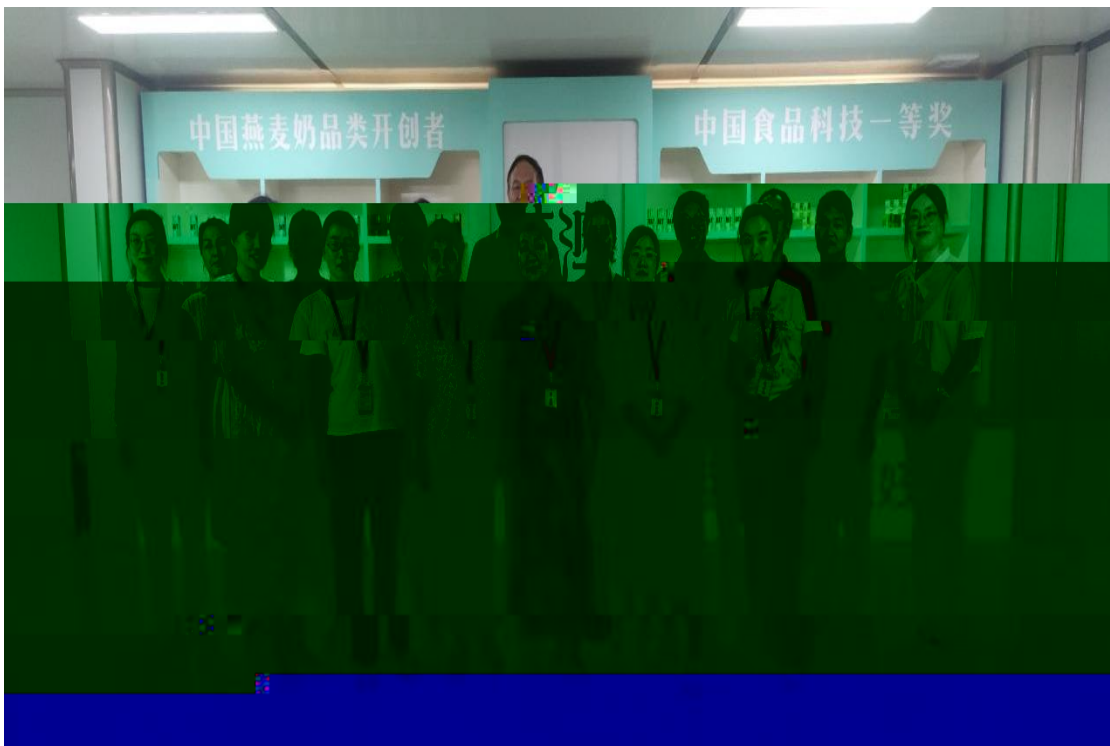
2024 7 ， 发 队成 合