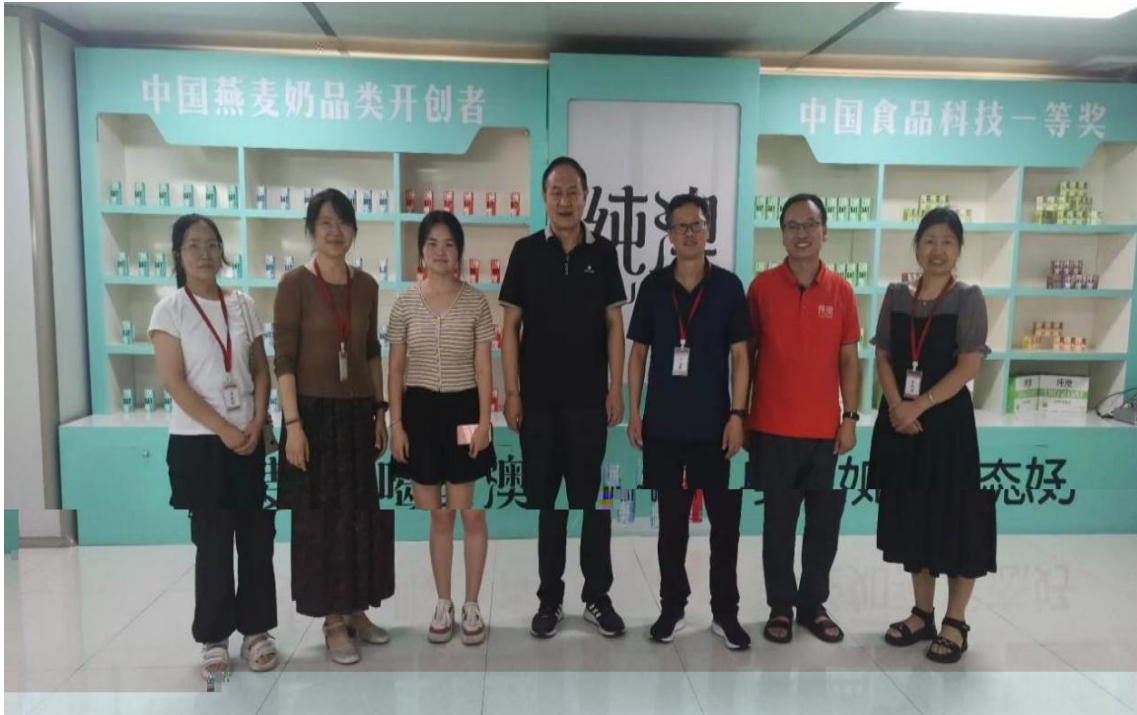
2024 5 , 河 工程 导