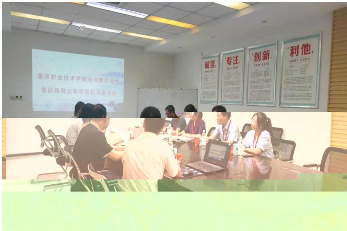
2024 5 , 工